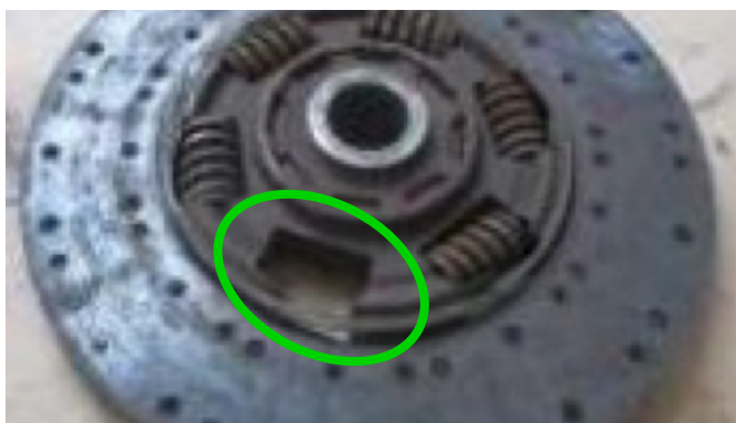
Brakujące sprężyny tłumika skrętnego.