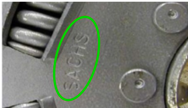
Marka SACHS musi być czytelna na części.