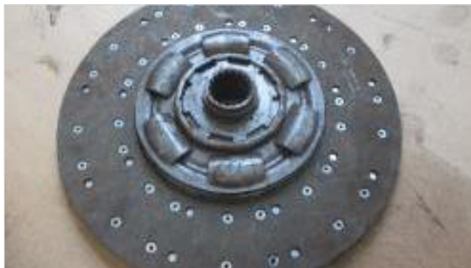
Marka musi być czytelna na części.