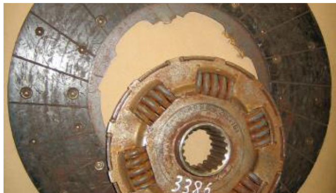
Tarcza sprzęgła jest wygięta lub złamana. Talerz jest złamany. Tłumik jest uszkodzony.