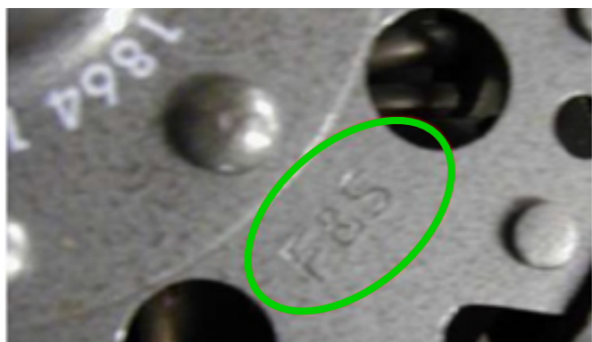
Marka SACHS musi być czytelna na części.