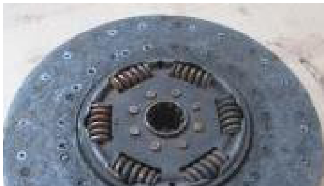
Marka musi być czytelna na części.