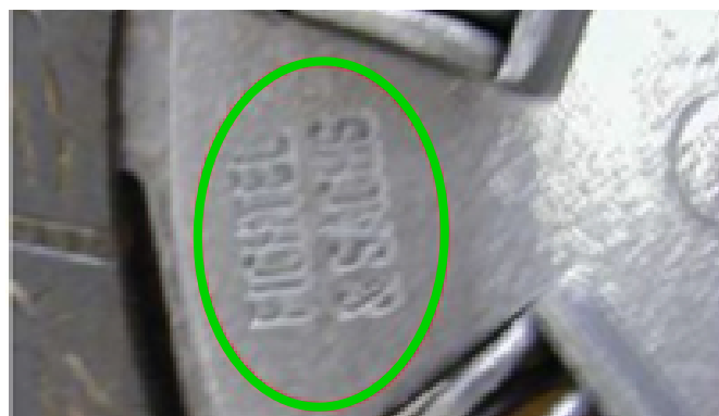
Marka SACHS musi być czytelna na części.