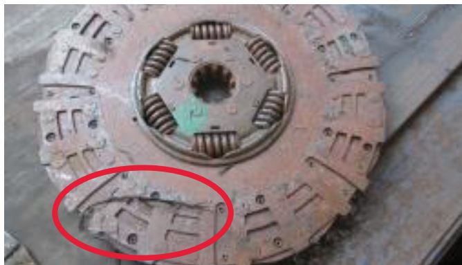
Tarcza sprzęgła jest wygięta lub złamana. Talerz jest złamany. Tłumik jest uszkodzony.